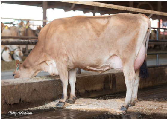
JX PROGENESIS MINNIE {5} DAUGHTER